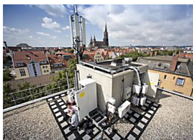
Südwest Presse Online Mobilfunkstandorte werden ausgebaut und neue gesucht