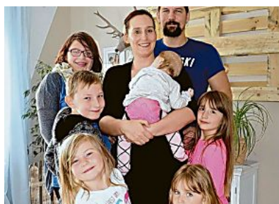
Lokale Nachrichten "Brauche keinen Ehrentag"