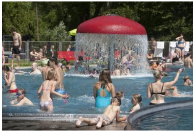
Ulm/Neu-Ulm Empörung nach Übergriffe in Kirchheimer Schwimmbad