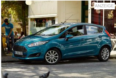
Der Ford Fiesta - Jetzt konfigurieren