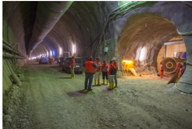
Ulm/Neu-Ulm Bahn-Baustelle Wendlingen-Ulm: Hohraum entdeckt