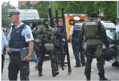
Münsingen Tote in Kanzlei: Anwalt schuldete mutmaßlichem...