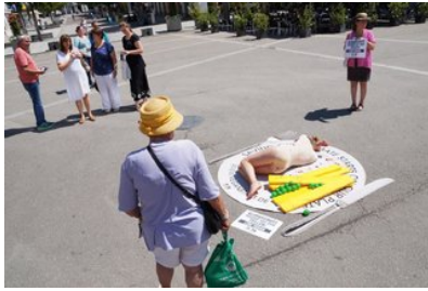
Göppingen Peta: Nacktes Fleisch auf dem Marktplatz