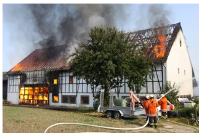
Schwäbisch Hall „Da ist nichts zu retten“ – Bauhof brennt völlig...