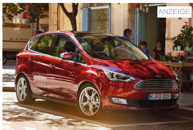
Der Ford C-Max