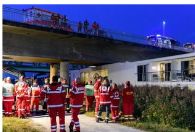
Metzingen Flusskreuzfahrtschiff rammt Brücke: Zwei Crew...