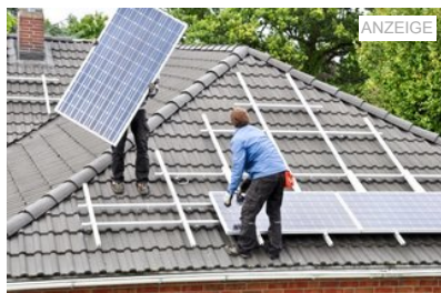
Was kostet eine Photovoltaik-Anlage?