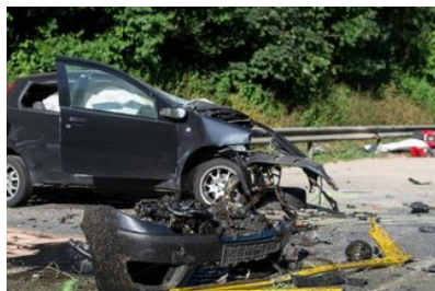
Göppingen Drei Menschen sterben bei Verkehrsunfall...