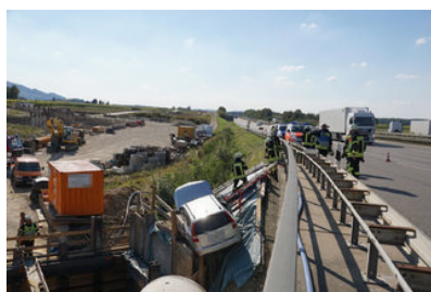
Göppingen Autofahrerin rast auf A 8 in Baustelle