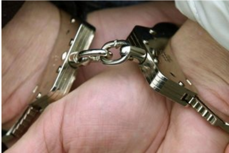
Göppingen Mordfall Nadine E.: Polizei nimmt Ehemann fest