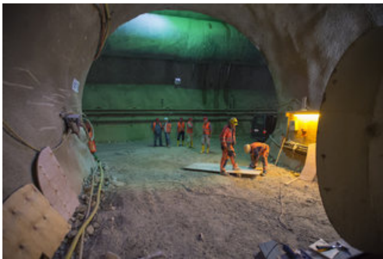
Ulm/Neu-Ulm 100 Meter lange Höhle unter der Bahn