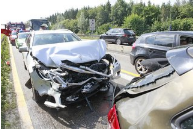
Ulm/Neu-Ulm Vollsperrung der A7 nach schwerem Verkehrsunfall